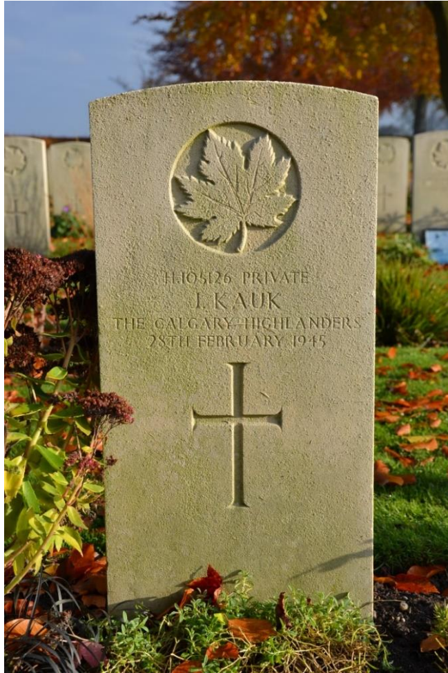
Groesbeek, 20 november 2020 – foto Sigrid Norde.